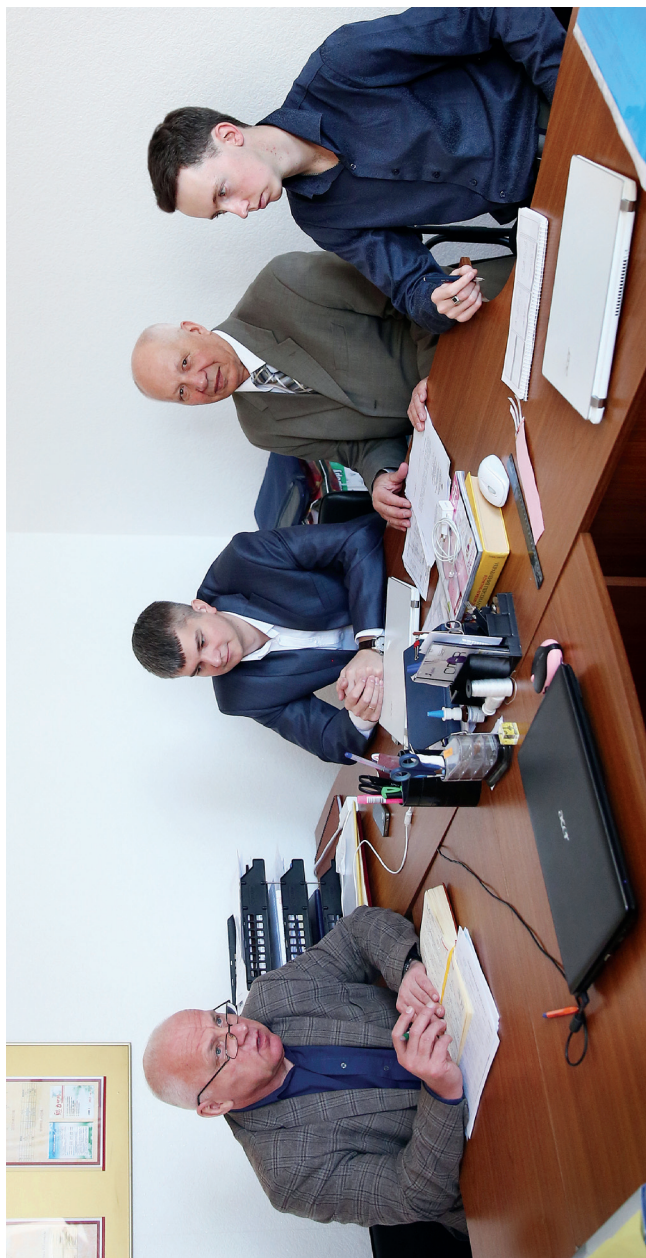
Заседание кафедры менеджмента экономического факультета, 2016 г.