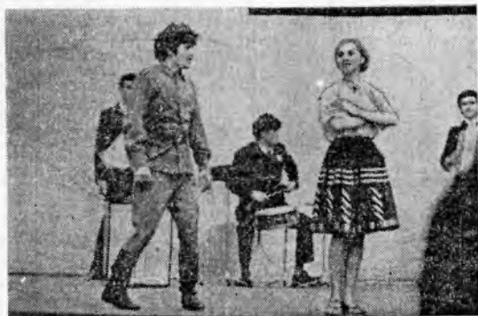
Шуготный танец исполнили студенты зоофака.