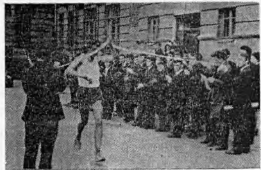
На финише забега на приз газеты «За сельскохозяйственные кадры».