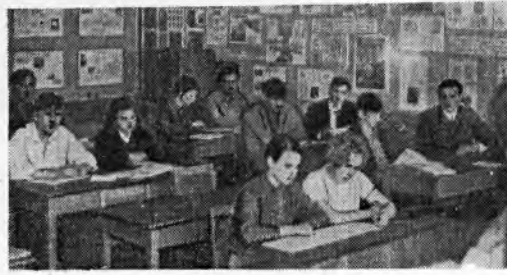
Идут последние лекции, лабораторные и семинарские занятия. Впереди — сессия.