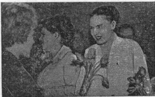
Выпускники зоофака встретились вновь в родном институте.

НА НЕДАВНЕМ внутринститутском фестивале со своей концертной программой выступили самодеятельные артисты зоофака. Они серьезно готовились к нему, составили разнообразную программу, которая отражала дружбу и единство народов нашей страны, регулярно проводили репетиции.