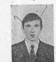
ОТЛИЧНИК учебы, староста курса, ведущий