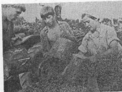
Дружно кипит работа у первокурсников зоотехнического факультета.