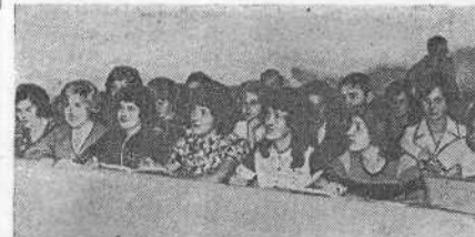
Лучшая на экономическом факультете 2 группа V курса.

учаза — на Бударке. Мы собирали огурцы, выкапывали морковь, пропалывали помидоры, а после рабочего дня, уставшие от палящего зноя и рабо-