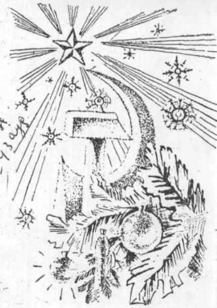
Рисунок Г. ЗЮЗНА.