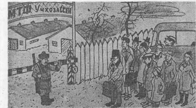
Здесь на фермах, верте, братья, уши нам щипал мороз...

В. ЧЕРЕПАНОВ, IV курс агрофака, слушатель отделения журналистики ФФП.