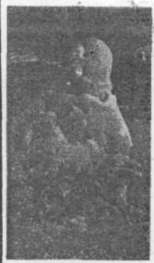
Метель ей пела песенку...