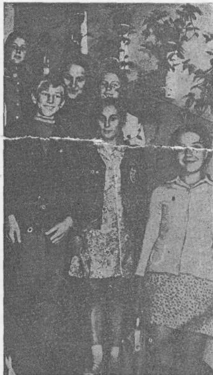
ЭТОТ учебный год школьники х. Демкина учхоза института начали в новом, прекрасно оборудованном здании средней школы. Хорошее настроение у ребят!

Одновременно с подведением итогов работы за год коллектив хозяйства взял повышенные обязательства на 1975 год. Подсчитав свои возможности, мы решили досрочно выполнить пятилетний план