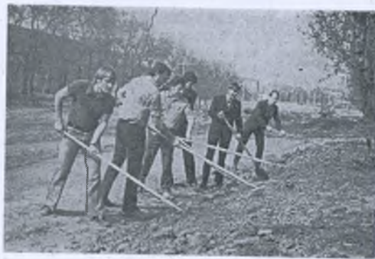
Студенты IV курса факультета механизации на Ленинском коммунистическом субботнике.

Н. ОВСЯНИКОВСКАЯ, председатель местного комитета.