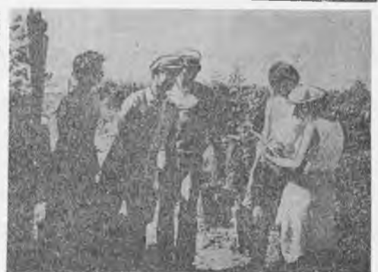
В ОБСТАНОВКЕ настоящего трудового подъема проходят у первокурсников института выборы комсомольского собрания. Комсомольцы агрономического факультета на уборке винограда в совхозе «Прасковевский» (на снимке) стремятся ознаменовать их новыми производственными достижениями.