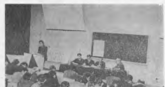
С БОЛЬШИМ интересом занимаются в СНО согни будущих инженеров. НА СНИМКЕ: идет научная студенческая конференция.

Д. МОЛЧАНОВ, выпускник факультета механизации 1959 года.