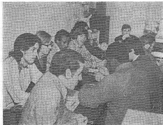
Дружеская беседа в комитете ВЛКСМ.