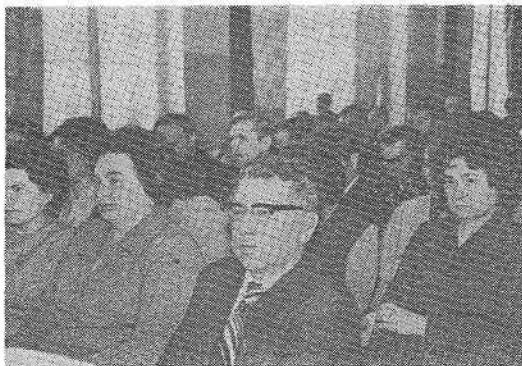
Идет пленарное заседание.

ных, разработка вопросов экс- плуатационных показателей МТП, совершенствование механизиро- ванных работ в орошаемом земле- делии, разработка схем и системы машин комплексной электромехани- зации животноводческих ферм, совершенствование организаци- и технологии ремонта сельскохо- зяйственной техники, повышение экономической эффективности сельскохо- зяйственного производ- ства в условиях индустриализации, социально - экономические про- блемы села в условиях научно- технической революции, совершен- ствование учебного процесса путем применения технических средств и методов программиро- ванного обучения в сельскохо- зяйственных вузах.