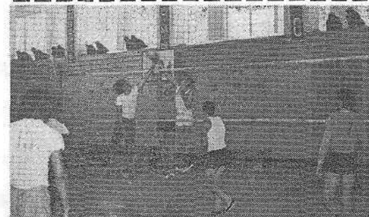
НА СНИМКЕ: момент встречи по волейболу мужских команд факультетов механизации и электрификации.