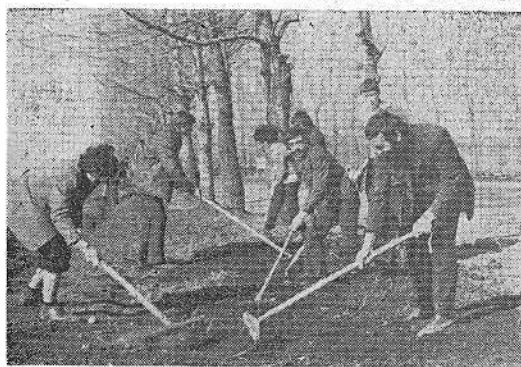
На снимках: студенты факультета механизации на субботнике.

С 1 по 17 апреля в нашем институте проходил Коммунистический субботник, посвященный 106-й годовщине со дня рождения В. И. Ленина.