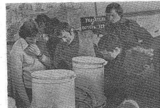
ПРОИДЕТ немного времени, и в институте наступит пора массовой сдачи зачетов и экзаменов. А пока идут занятия, идет подготовка к приближающейся сессии. На снимках, сделанных нашими фотокорреспондентами