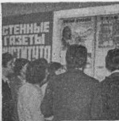
На снимках: на вечере «А ну-ка, девушки!» идет конкурс по приготовлению блюд; на консультации по курсовому проектированию; повесили новую газету!