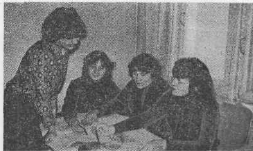
На снимке: самоподготовка в общежитии.

Советское правительство проявляет особую заботу о рабочих и колхозниках, организует рабочие факультеты при вузах. В нашем институте подготовительное отделение существует уже 10 лет. Выпускники его, вливаясь в состав студенчества института, составляют костяк групп, являются умельцами организаторами, активистами, знатоками многих полезных дел.