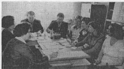
На снимке: идет методическое совещание преподавателей подготовительного отделения.