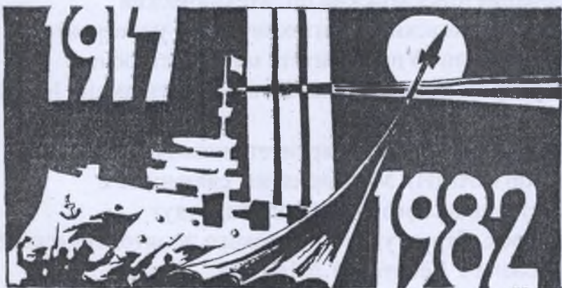
Рисунок И. ВАКУЛИНА.

ПУСТЬ ЕЩЕ СИЛЬНЕЕ, БОГАЧЕ И КРАШЕ СТАНЕТ НАША ВЕЛИКАЯ МНОГОНАЦИОНАЛЬНАЯ РОДИНА! (Из Прозывов ЦК КПСС к 65-й годовщине Великой Октябрьской социалистической революции).