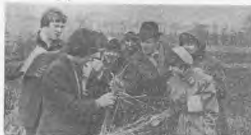
В НАУЧНЫХ исследованиях участвуют студенты.

В последние годы значительно возросла роль опытной станции в учебном процессе. Более 200 студентов ведут у нас научные исследования. Только в нынешнем году подготовлено 76 курсовых и дипломных работ. В коллекционных питом-