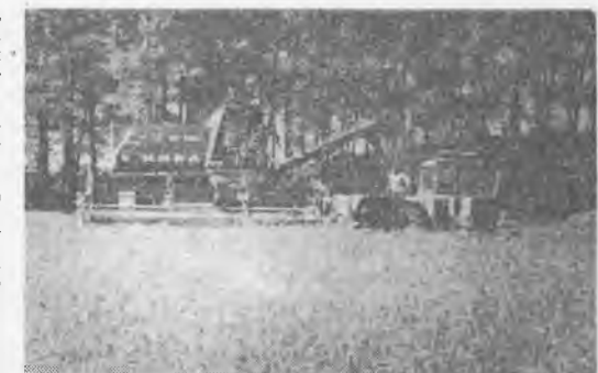
УБОРКА элитной пшеницы.

Со времени преобразования опытного поля института в опытную станцию прошло всего 7 лет. Но за эти годы она стала экспериментальной базой научного поиска. Здесь мысль ученого проходит первую производственную проверку, а затем становится рекомендацией