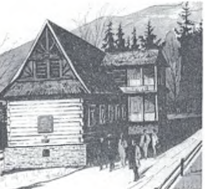
Белый Дунаец. Мемориальный музей В. И. Ленина.

Наше знакомство с Польской Народной Республикой началось с посещения Законапе, небольшого городка, расположенного в живописной долине у подножия Татр, вершины которых почти круглый год покрыты снегом. Известный своими спортивными сооружениями, трамплинами, интереснейшим архитектурным ансамблем построенных домов, где каждый дом не похож ни на один другой. Нам, советским людям, он привлек более всего тем, что отсюда начиналось наше путешествие по ленинским местам. Здесь один из самых длинных маршрутов назван «ленинским» в память о Владимире Ильиче, любившем уходить далеко в горы.