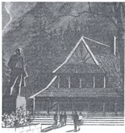
Поронино. Музей и памятник В. И. Ленину.