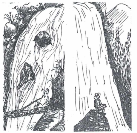
В горах Теберда.