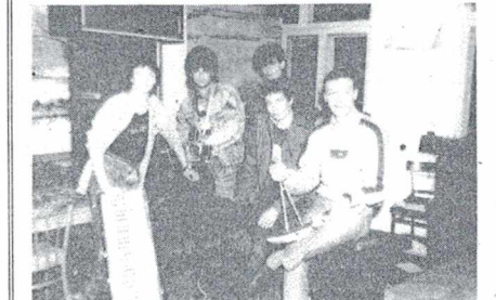
Ансамбль «Канал связи».

А. АМИРДЖАНИЯН, редактор газеты агрономического факультета «Ученый агроном».