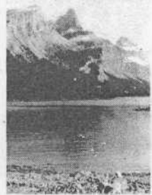
Озеро и река Мира в канадской провинции Альберта, где наши студенты осенью 1989 года были на практике.