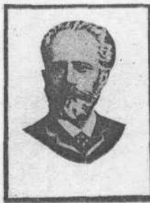
П. И. Чайковский родился 7 мая 1840 года в семье горного инженера в г. Воткинске. Музыкальность в нем проявилась рано. Уже в четырехлетнем возрасте сочинил пьеску под названи-

ем «Наша мама в Петербурге». В восемь лет довольно хорошо играл на фортепьяно. Воспитателем мальчика Фанин Дюрбах вспоминала, что однажды, войдя в детскую, она увидела, что мальчик не спит и плачет. На вопрос, что с ним, он отвечал: «О, эта музыка, музыка! Избавьте меня от нее! Она у меня здесь, здесь, — рыдая и указывая на голову, — она не дает мне покоя!» Каждый вечер предоставленный сам себе, он шел к фортепьяно, и если ему запрещали быть у инструмента, то продолжал на чем попало перебирать пальцами. Одижды, ушел с этим немалым бременем на стекле оконной рамы, он так разошелся, что раз-