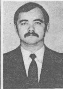
Русский, беспартийный, возраст 37 лет. В 1979 году получил диплом с отличием факультета электрификации сельского хозяйства.

А решениями парткома, комитета ВЛКСМ, студпрофкома института самые лучшие организаторы подписки на нашу газету будут поощрены денежными премиями.