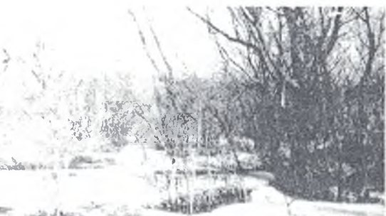
С первых мартовских проталин началась весна.

Под знаком сосны родились: Коперник, Вашингтон, Шопен, Шопенгауэр, Карузо, Элизабет Тейлор, Конфуций, мать Наполеона.