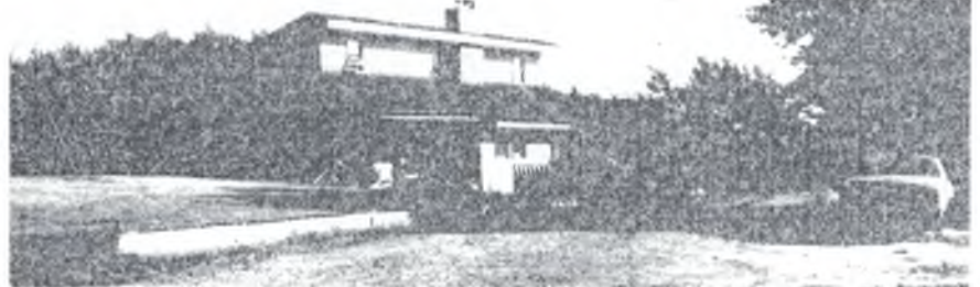
Дом канадского фермера в провинции Альберта. Фото О. ПАСТУХОВА, выпускника мехфака 1990 года.

Интервью провел и записал А. ФИСУНОВ, студент II курса мехфака, слушатель отделения журналистики ФЮИ.