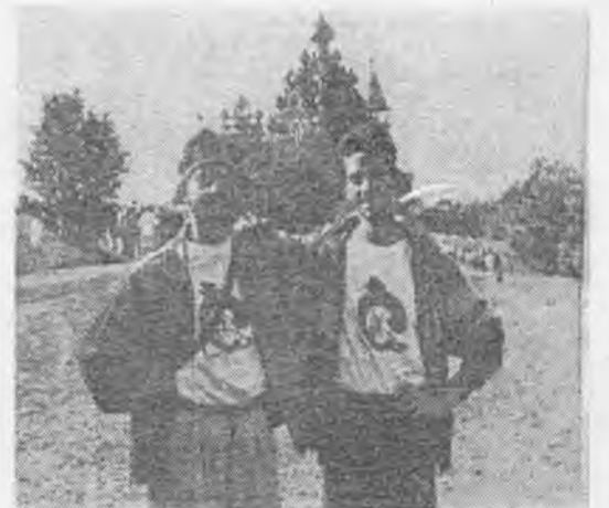
Победители «Робинзонады» увидели чудо деревянного родчества Кияки.