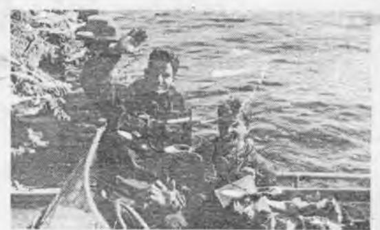
«Причал, большая земля!»